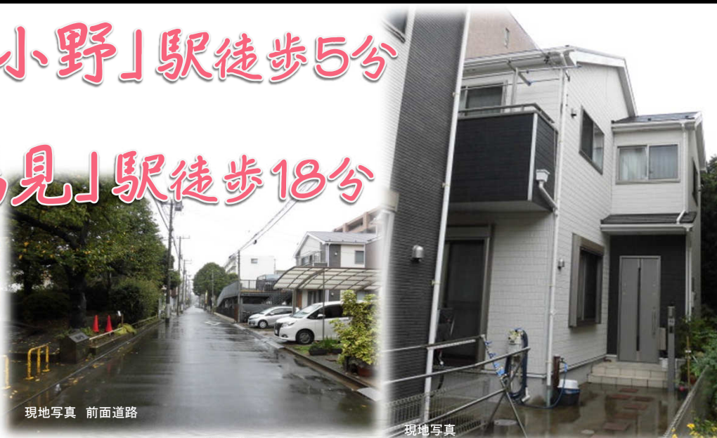
現地写真 前面道路